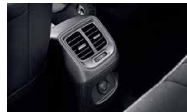
Cửa gió điều hòa hàng ghế thứ 2