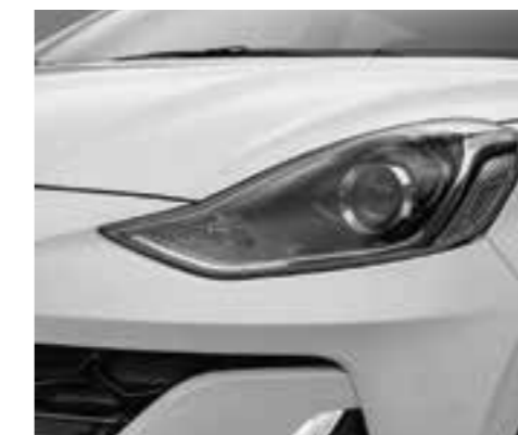
Đèn chiếu sáng Halogen projector