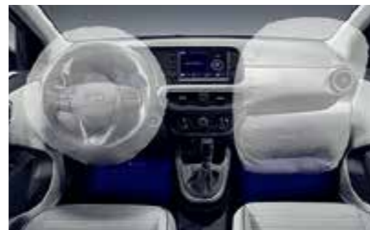
Hệ thống 4 túi khí