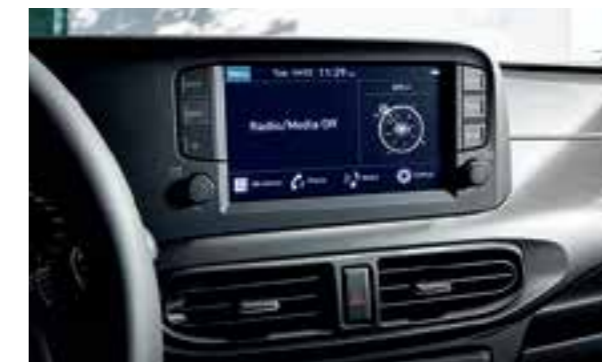
Màn hình giải trí 8 inch