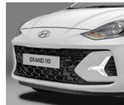
Lưới tản nhiệt màu đen bóng