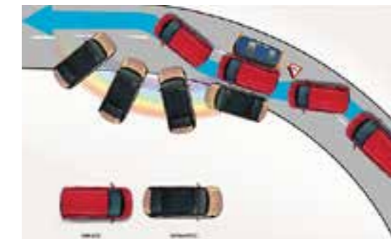
Hệ thống cân bằng điện tử ESC