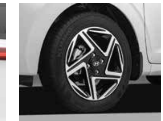
Mâm xe hợp kim 15" thể thao