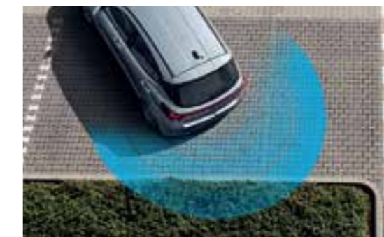
Cảm biến lùi