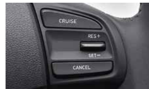
Điều khiển hành trình