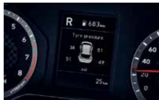
Cảm biến áp suất lốp TPMS