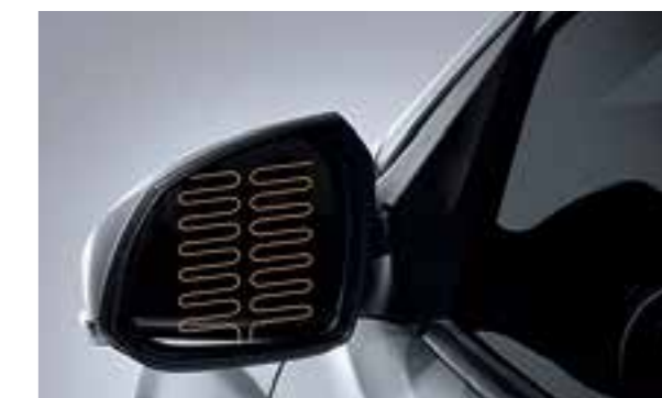
Gương chiếu hậu chỉnh điện gập điện, sấy điện