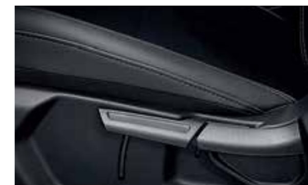
Ghế lái điều chỉnh 6 hướng