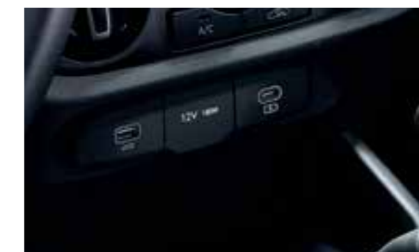
Cổng sạc Type C