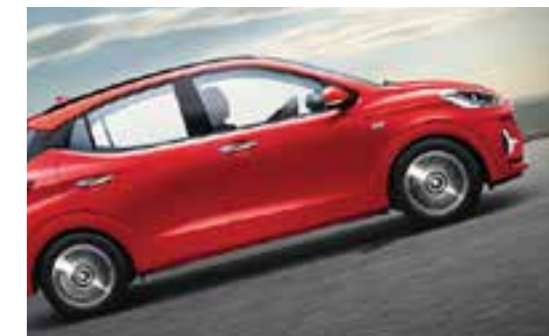
Hệ thống hỗ trợ khởi hành ngang dốc HAC