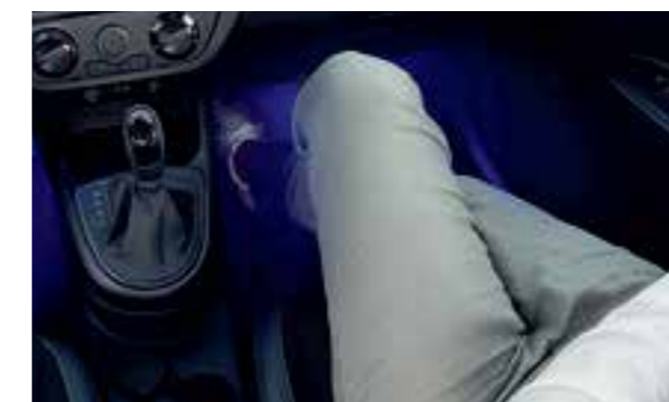
Đèn nội thất