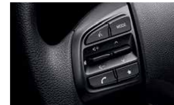
Cụm điều chỉnh media tích hợp nhận diện giọng nói