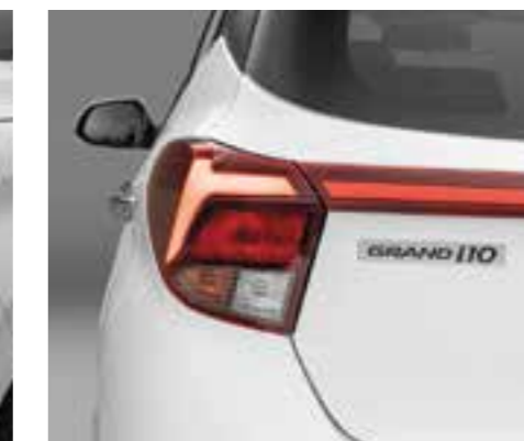
Cụm đèn hậu LED