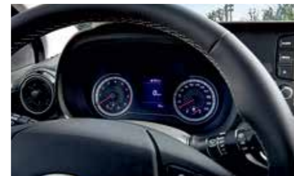
Màn hình thông tin 3.5 inch

Nội thất hiện đại, hoàn thiện kết hợp với không gian rộng rãi làm cho những chuyến đi dài trở thành một trải nghiệm thú vị.